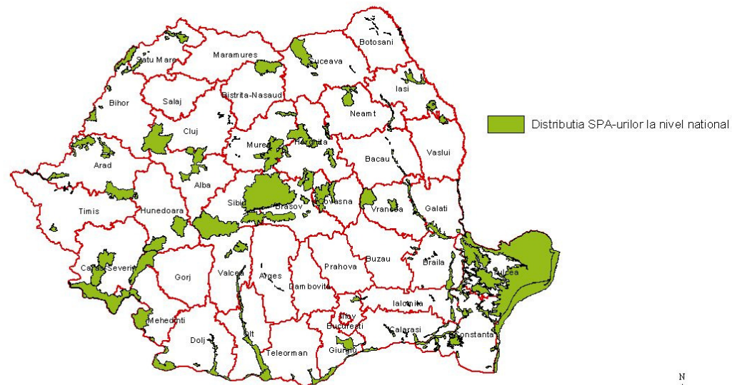
HARTA SITURILOR DE PROTECTIE SPECIALA AVIFAUNISTICA